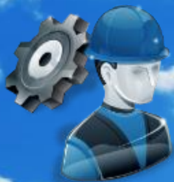
Слесарь - сборщик